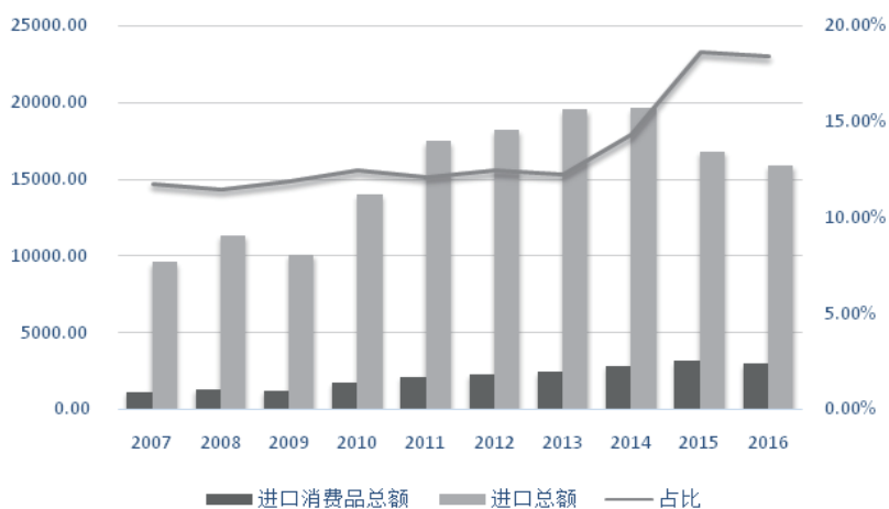
图2 按HS分类中国进口消费品总额及比重 ①

在国务院连续公布的进口促进政策的推动下，中国消费品进口在2012年后均呈现大幅增长态势。如图2所示，中国一般消费品进口在2012年前其进口占全年总进口额的比重一直